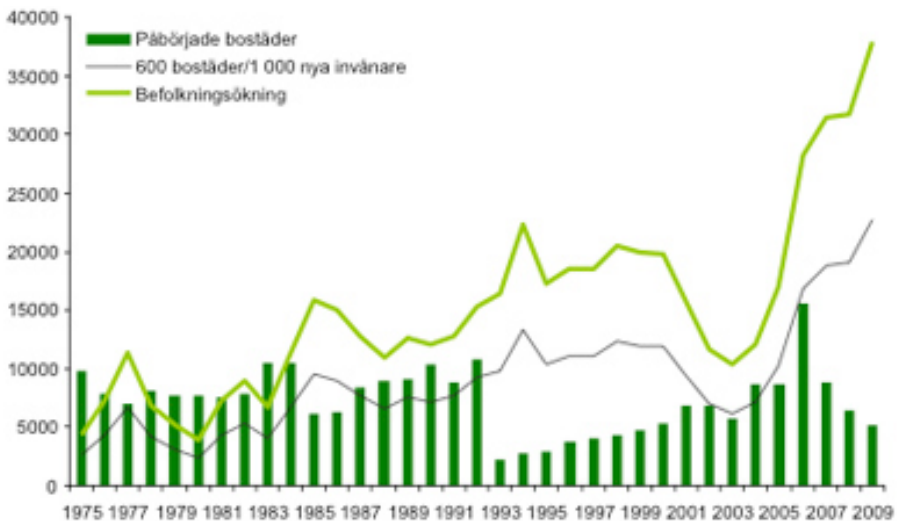
Påbörjade lägenheter 1975-2009. Från Länsstyrelsen i Stockholms län: Bostadsmarknaden i Stockholms län 2012