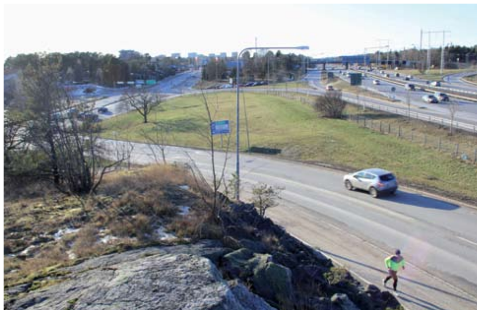
Centralt belägen trafikslum som kan bebyggas om trafiken grävs ner och/eller sprids ut. Västertorpsmotet.

torleder. Bara bullerzonerna runt E4 är lika stora som innerstan. Detta kräver förstås att dessa leder graderas ner till vanliga gator i den mån deras trafik är måttligt hög (t.ex. Örbyleden), eller om trafiken är hög gräva ner körbanorna i schakt eller tunnlar (främst E4). Detta är en metod som har beslutats i Helsingfors (Generalplan för Helsingfors, 2013).